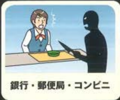
銀行・郵便局・コンビニ