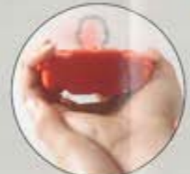
構え方：両手でしっかり構え狙いをつけてスイッチを押す